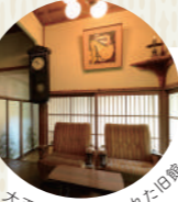
大正時代に建てられた旧館