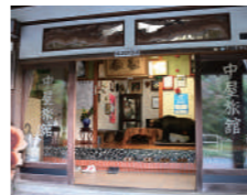
趣のあるエントランス

宿 16,500円～ 食事(入浴付) デイユース:8,800円～ (11:00～16:00・最大5時間) ※2名様より、要予約。 ※お食事なしの場合は6,600円～ 住 厚木市七沢 2750 問 046-248-0008 休 不定休 「七沢温泉入口」下車 徒歩18分