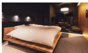
露天風呂付きデザイン客室