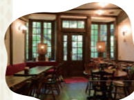
館内「玉川麓カフェ」

宿 16,870円～ 食事(入浴付) 6,600円～ デユース:10,560円～(11:30～17:30) 住 厚木市七沢 2776 問 046-248-0002 休 火曜・水曜 「七沢温泉入口」下車 徒歩18分