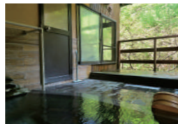
緑が望める露天風呂