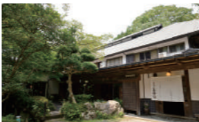
農家を移築した建物