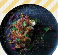
こだわりのフレンチをご堪能あれ