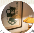
「のらくろ」田河水泡温泉の湯